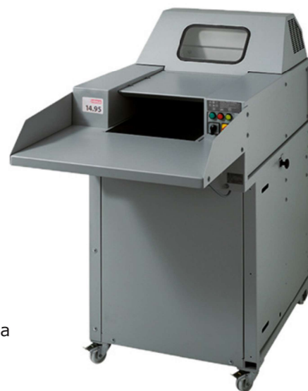
S/D/W 80/120 x 168 x 164 cm

Od dziesięcioleci niszczarki przemysłowe Intmus przeznaczone do pracy w ciężkich warunkach stanowią centralnie rozmieszczone urządzenia do bezpiecznego usuwania danych. Przestronny stół podający ze zintegrowanym przenośnikiem taśmowym zapewnia kontrolowane, łatwe, bezpieczne i szybkie napełnianie niszczarki. Kombinacja niszczarki z belownicą umożliwia natychmiastowe w pełni automatyczne zagęszczanie ciętego materiału w zwarte bele. Efekt redukcji w porównaniu do luźnej ścinki wynosi około 70%