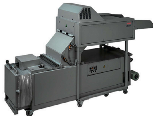
D/S/W 268/327 x 80 x 164 cm

Od dziesięcioleci niszczarki przemysłowe Intmus przeznaczone do pracy w ciężkich warunkach stanowią centralnie rozmieszczone urządzenia do bezpiecznego usuwania danych. Przestronny stół podający ze zintegrowanym przenośnikiem taśmowym zapewnia kontrolowane, łatwe, bezpieczne i szybkie napełnianie niszczarki. Kombinacja niszczarki z belownicą umożliwia natychmiastowe w pełni automatyczne zagęszczanie ciętego materiału w zwarte bele. Efekt redukcji w porównaniu do luźnej ścinki wynosi około 70%