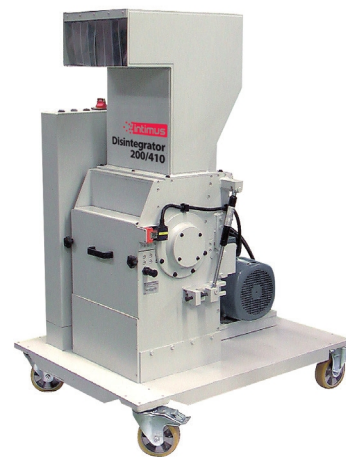
S/G/W 88 x 115 x 150 cm

Im wyższe wymagania dotyczące klasy tajności, tym nośnik danych należy rozdrobnić na mniejsze elementy. W przypadku konwencjonalnych niszczarek oznacza to, że wały tnące stają się coraz bardziej delikatne, a tym samym bardziej podatne na uszkodzenia i nadmierne zużycie. Dezintegratory Intimus z racji zastosowania rotora z nożami oraz sita, odporne są na zużycie zapewniając przy tym wysoką klasę tajności, dużą wydajność i komfort pracy. Niewątpliwym atutem są wymienne sita z różnymi wielkościami otworów. Łatwo wymienne sita pozwalają sprawnie zmienić klasę tajności w zależności od aktualnych potrzeb przedsiębiorcy. Dezintegratory Intimus DIS doskonale sprawdzają się w użytku przemysłowym jak również w placówkach rządowych, wojskowych i wytwórniach papierów wartościowych.