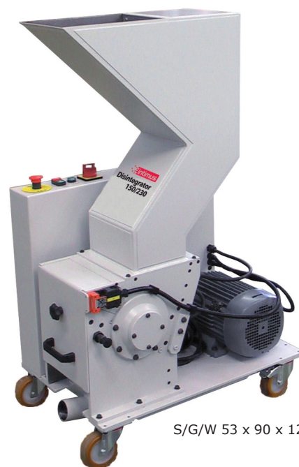
S/G/W 53 x 90 x 124 cm

Dezintegrator Intimus DIS to urządzenie oparte na sprawdzonej technologii i wieloletnim doświadczeniu. Doskonale nadaje się do niezawodnego i ekonomicznego niszczenia papieru i tworzyw sztucznych w postaci dokumentów, banknotów, paszportów, nośników magnetycznych takich jak karty plastikowe czy dyskietki a także nośników optycznych takich jak płyty CD lub DVD.