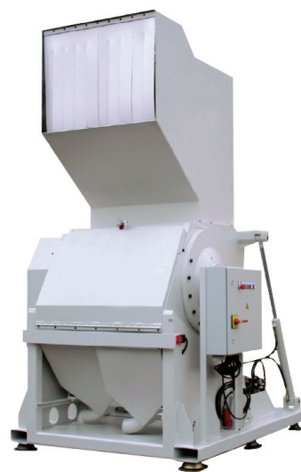
S/G/W 169 x 210 x 321 cm

Im wyższe wymagania dotyczące klasy tajności, tym nośnik danych należy rozdrobnić na mniejsze elementy. W przypadku konwencjonalnych niszczarek oznacza to, że wały tnące stają się coraz bardziej delikatne, a tym samym bardziej podatne na uszkodzenia i nadmierne zużycie. Dezintegratory Intimus z racji zastosowania rotora z nożami oraz sita, odporne są na zużycie zapewniając przy tym wysoką klasę tajności, dużą wydajność i komfort pracy. Niewątpliwym atutem są wymienne sita z różnymi wielkościami otworów. Łatwo wymienne sita pozwalają sprawnie zmienić klasę tajności w zależności od aktualnych potrzeb przedsiębiorcy. Dezintegratory Intimus DIS doskonale sprawdzają się w użytku przemysłowym jak również w placówkach rządowych, wojskowych i wytwórniach papierów wartościowych.