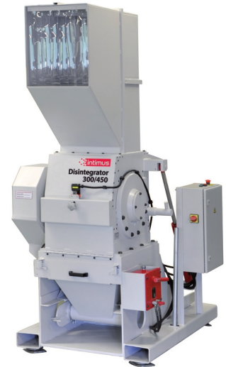
intimus DIS 300/450 S/G/W 112 x 129 x 206 cm intimus DIS 300 /600 S/G/W 127 x 129 x 206 cm

Im wyższe wymagania dotyczące klasy tajności, tym nośnik danych należy rozdrobnić na mniejsze elementy. W przypadku konwencjonalnych niszczarek oznacza to, że wały tnące stają się coraz bardziej delikatne, a tym samym bardziej podatne na uszkodzenia i nadmierne zużycie. Dezintegratory Intimus z racji zastosowania rotora z nożami oraz sita, odporne są na zużycie zapewniając przy tym wysoką klasę tajności, dużą wydajność i komfort pracy. Niewątpliwym atutem są wymienne sita z różnymi wielkościami otworów. Łatwo wymienne sita pozwalają sprawnie zmienić klasę tajności w zależności od aktualnych potrzeb przedsiębiorcy. Dezintegratory Intimus DIS doskonale sprawdzają się w użytku przemysłowym jak również w placówkach rządowych, wojskowych i wytwórniach papierów wartościowych.