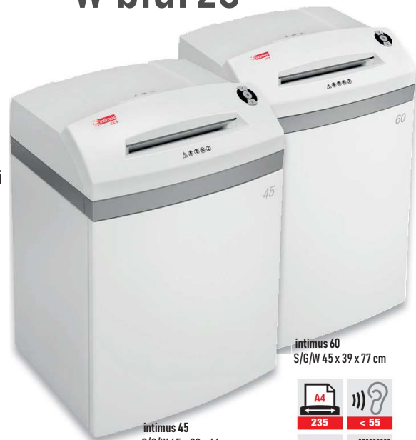
intimus 60 S/G/W 45 x 39 x 77 cm